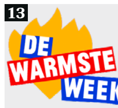
13 De Warmste Week