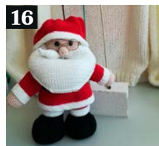
16 Maak kennis met de breiclub