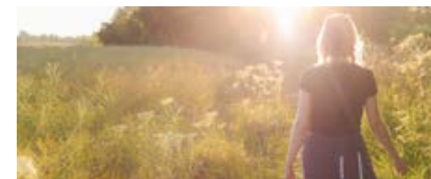
De lente- en zomeravondwandelingen zijn een initiatief van de Wervikse Wandelsportvereniging en de sportdienst van Stad Wervik

Meer info: Stad Wervik – Sportdienst (056 95 24 51) of dienst Vrije Tijd (056 95 24 60) of bij de Wervikse Wandelsportvereniging (056 31 27 90)