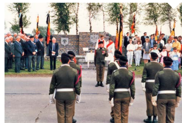
Herdenking aan het In Memoriam Monument langs de Dadizelestraat.