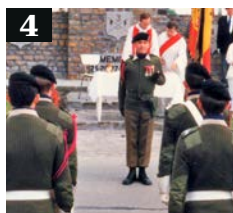
4 Slag om Geluwe

We konden voor ons eerste woord ook zoeken onder de letter “C”. Maar kozen voor de volgende letter in het alfabet omdat heel wat mensen een woord van dank verdienen in deze periode. Bij het ter perse gaan van deze editie van Waarheen was het opnieuw koffiedik kijken in wat voor tijden je deze zal lezen. Zijn de maatregelen inzake Corona achter de rug? Versoepeld? Verstrengd? Daarom zijn alle vermelde activiteiten ook onder voorbehoud. Maar dit wilden we als stadbestuur toch zeggen: Dank u wel! Dank u aan allen die meer dan hun steen hebben bijgedragen in deze periode. Oud, jong, blank, zwart, thuis, op het werk, ... Dank u! Dank u! Dank u!