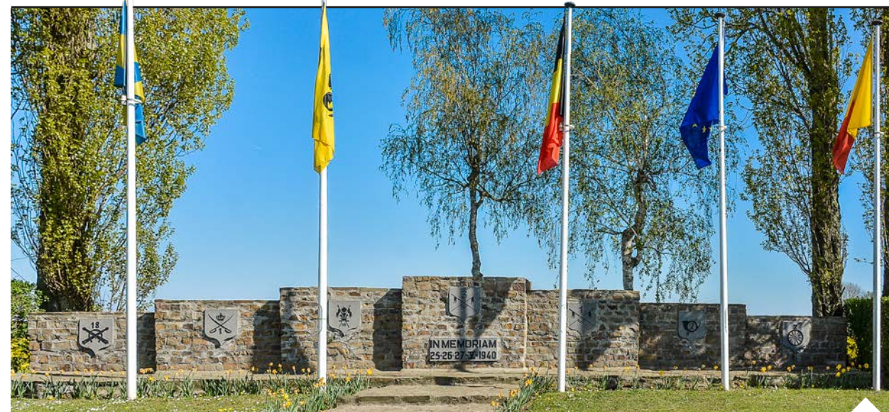
Het In Memoriam Monument langs de Dadizelestraat.

Slag om Geluwe betrokken waren, en één Brits dat meer naar achter ingezet werd.