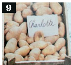
9 Tips van Tuinhier