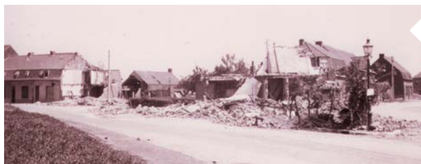
Op 25 mei 1940 vernielde een bombardement heel wat huizen van “De Reke” in Wervik.